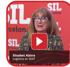
Elisabet Alsina Logística en SEAT